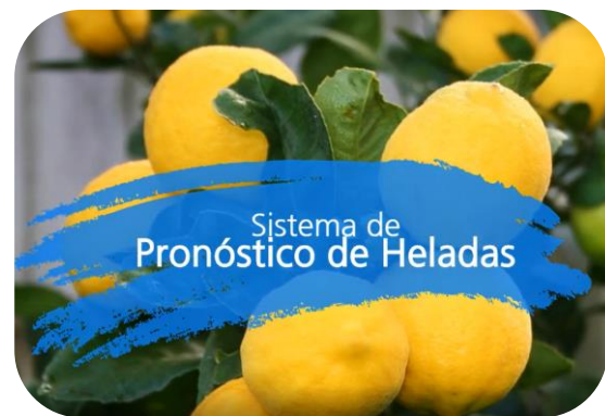
Sistema de pronostico de heladas