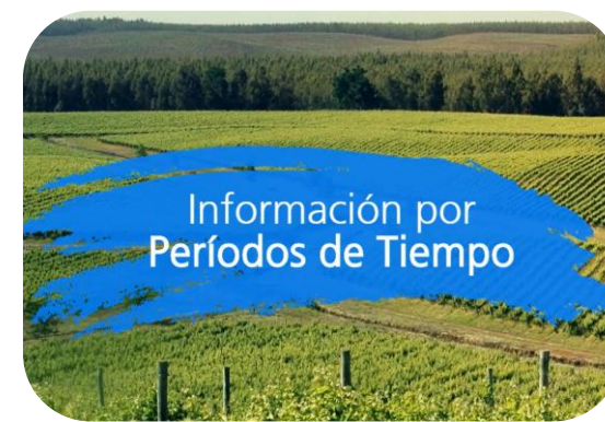
Información por periodos de tiempo