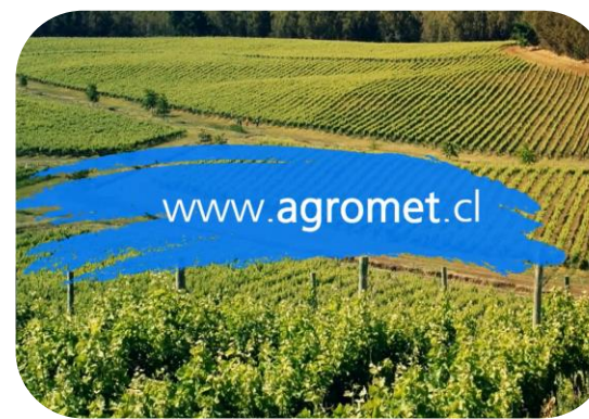
Acceso portal AGROMET