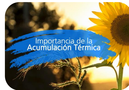
Importancia de la acumulación térmica